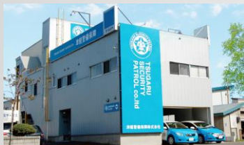
津軽警備保障株式会社 本社